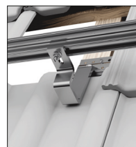
Dvojité panelové škridly